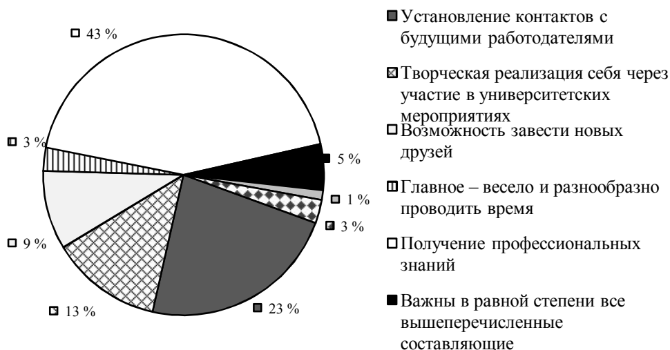
Рис. 2. Что самое важное в процессе обучения в вузе? /

На вопрос «Что, по Вашему мнению, самое важное в процессе обучения в вузе?» ответы распределились следующим образом (см. рис. 2):